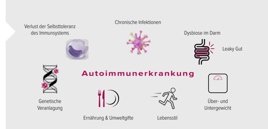
Auswahl an Faktoren, die die Entstehung von Autoimmunerkrankungen begünstigen

Auch Umweltgifte, Tabak- und Alkoholkonsum sowie ungünstige Ernährungsgewohnheiten können Entzündungen fördern. Bei einer Unterernährung fehlen dem Körper wichtige Mikronährstoffe für den Kampf gegen Entzündungen. Ein Übermaß an Zucker und gesättigten Fettsäuren kann dagegen die Ausschüttung von proentzündlichen Botenstoffen des Immunsystems stimulieren. Gleichzeitig können Zucker und gesättigte Fettsäuren zur vermehrten Bildung von Fettzellen beitragen, die wiederum selbst entzündungsfördernde Stoffe freisetzen und so beispielsweise Entzündungen in den Gelenken, in den Gefäßen oder im Nervensystem auslösen können. Übergewicht kann daher ebenso wie Untergewicht das Risiko für chronisch-entzündliche Erkrankungen erhöhen.